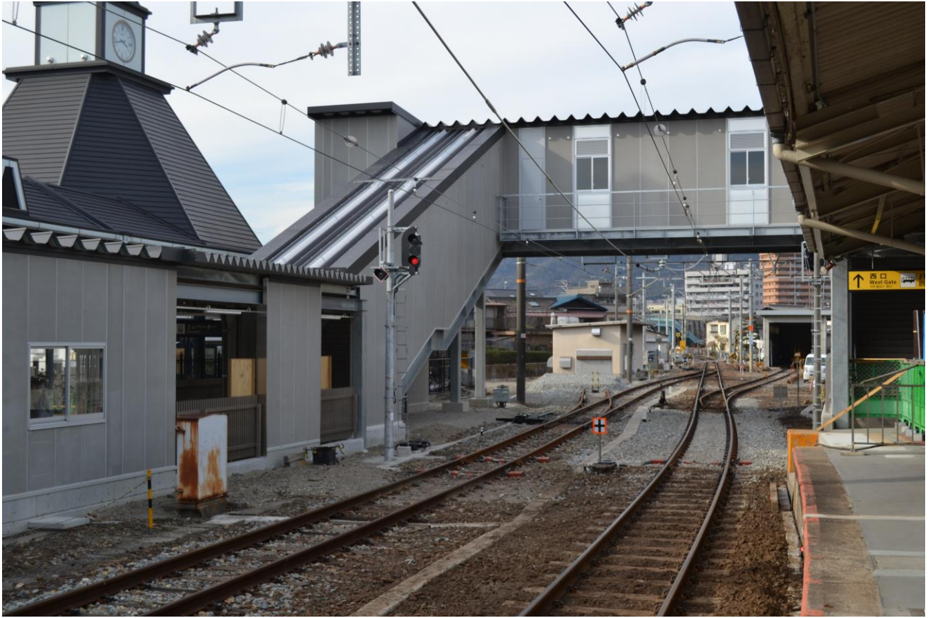
写真7 可部駅自由通路