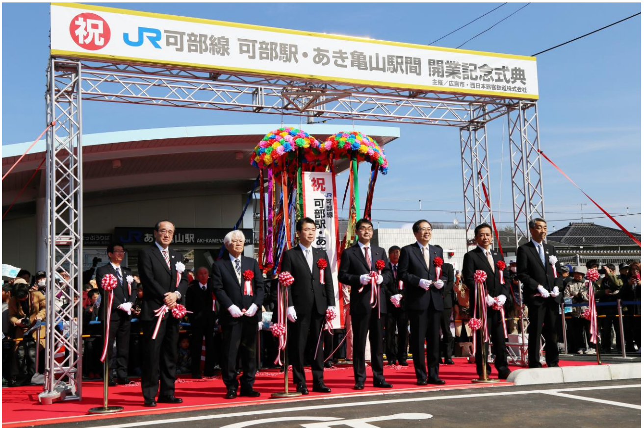
写真1 JR可部線可部駅・あき亀山駅間開業記念式典 テープカットの様子