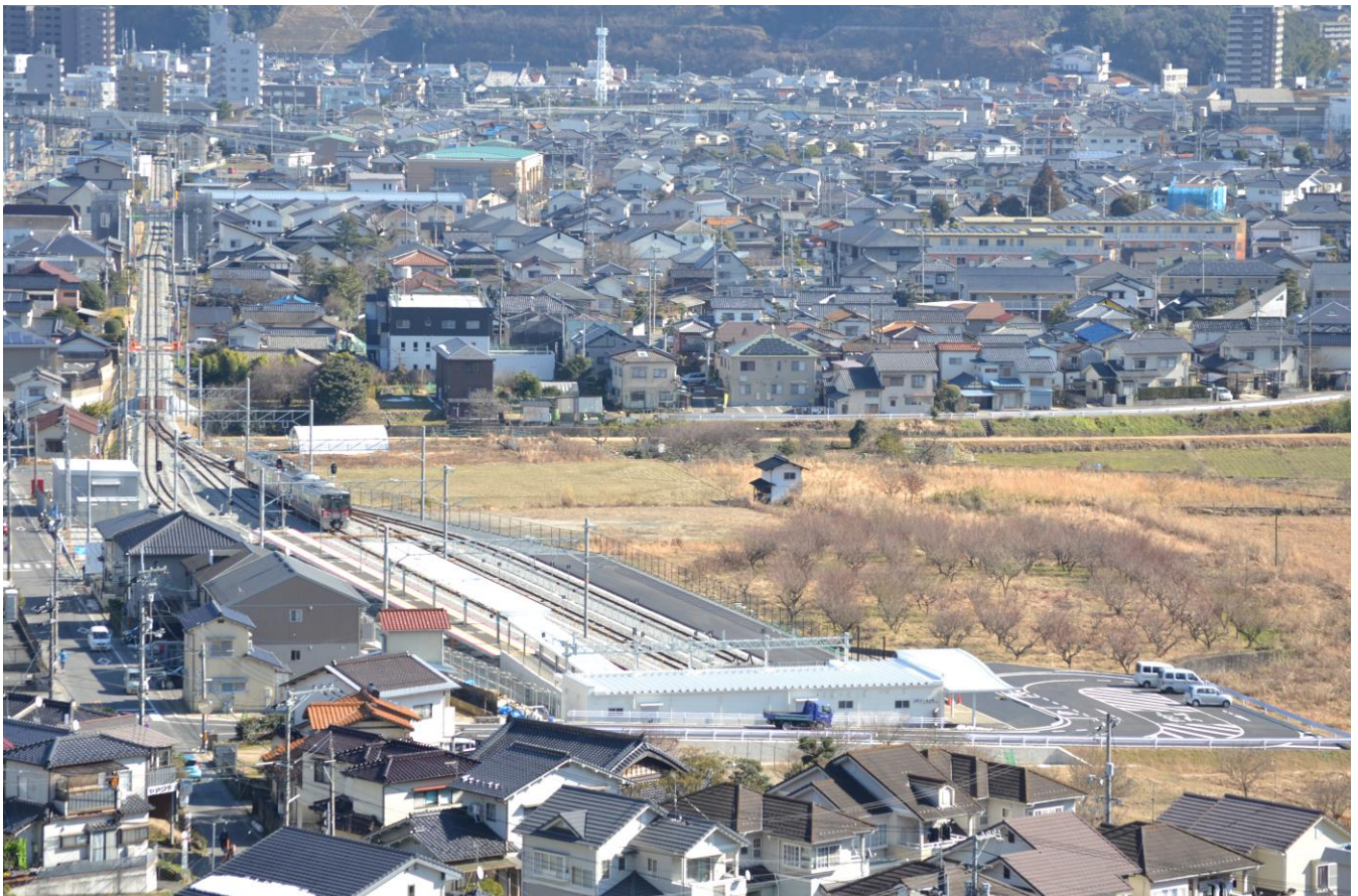
写真2 あき亀山駅遠景