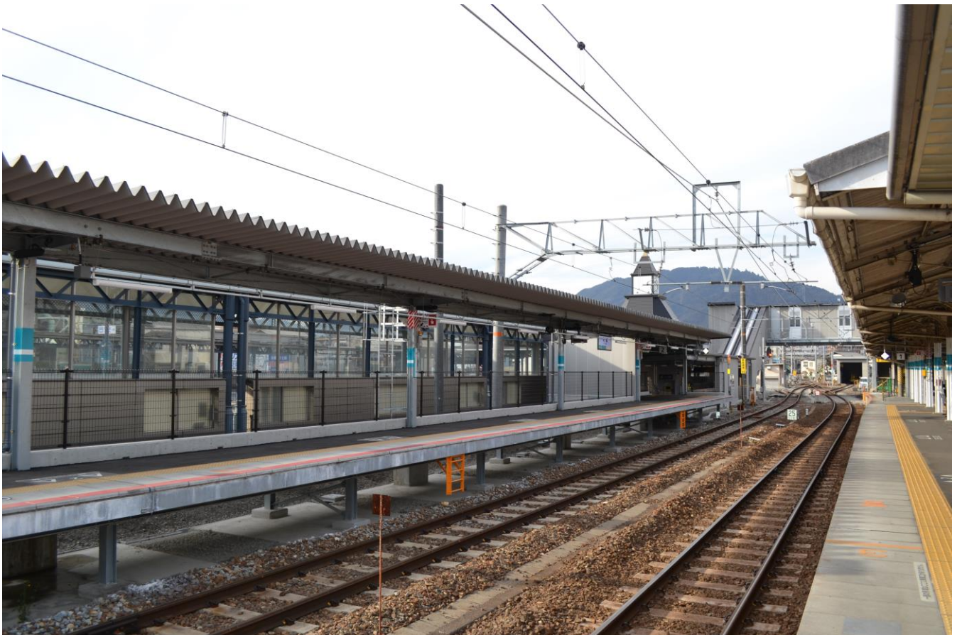
写真8 可部駅下り乗降場