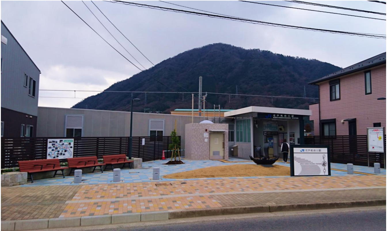
写真5 河戸帆待川駅前コミュニティスペース