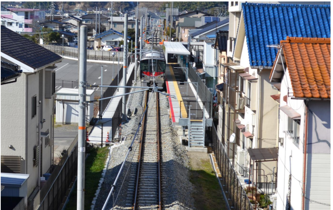
写真6 河戸帆待川駅（可部バイパスから望む）