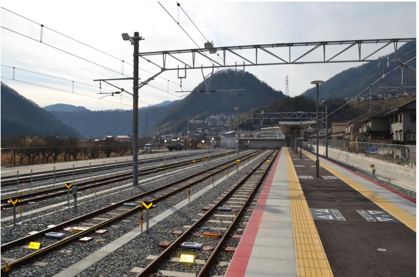
写真4 あき亀山駅構内