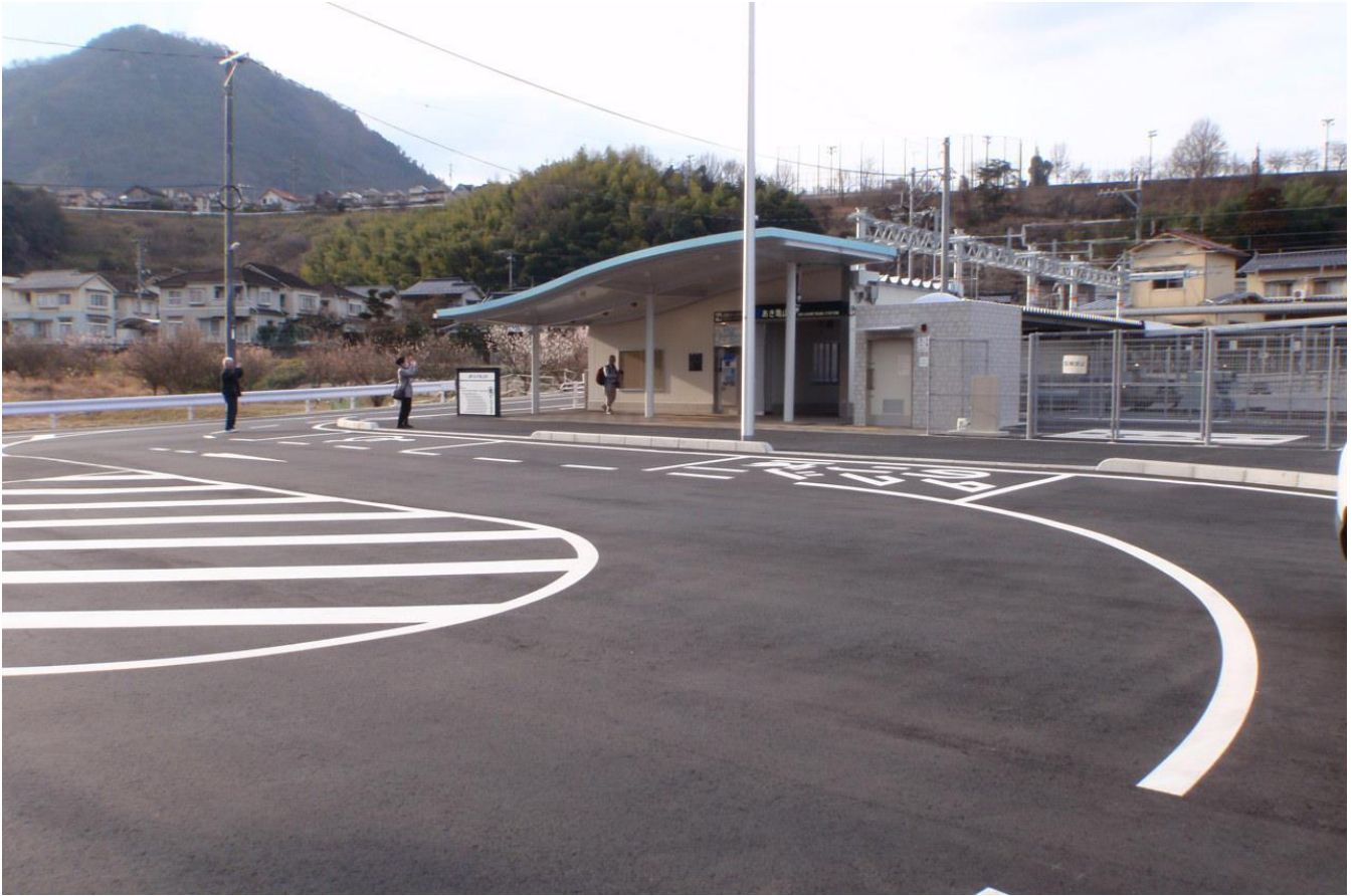
写真3 あき亀山駅及び駅前広場